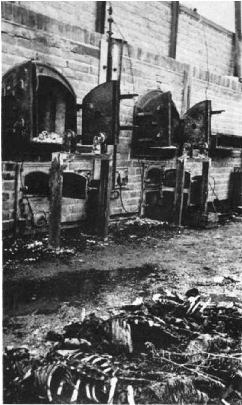
Abb. 31 : Angebliches Krematorium in Lublin (Maidanek) mit 5 Öfen.