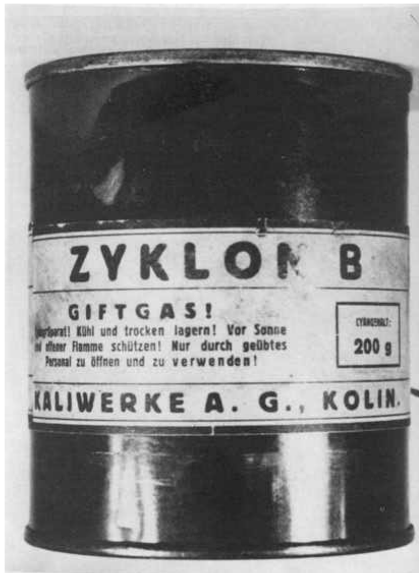
Abb. 27 : Eine Dose Zyklon B