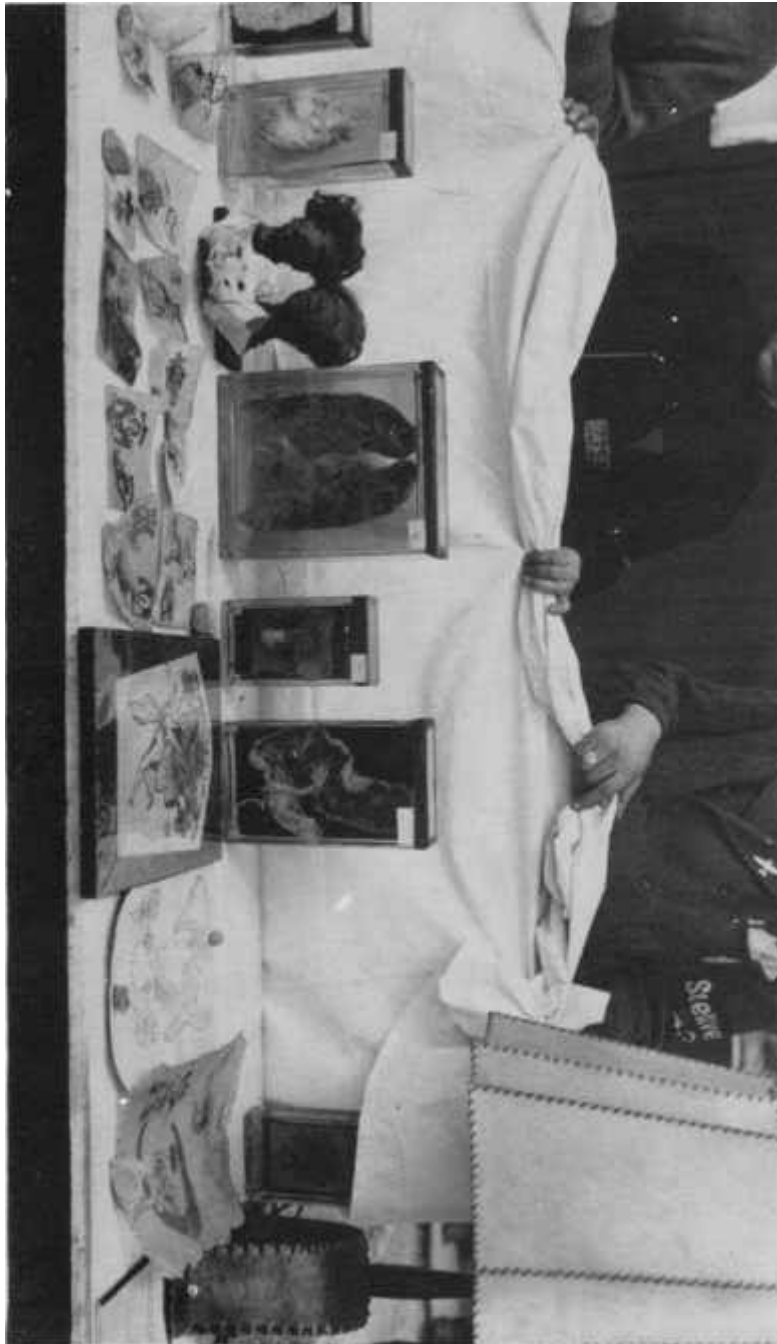
Abb. 32 : Sammlung medizinischer Muster, angeblich in Buchenwald gefunden