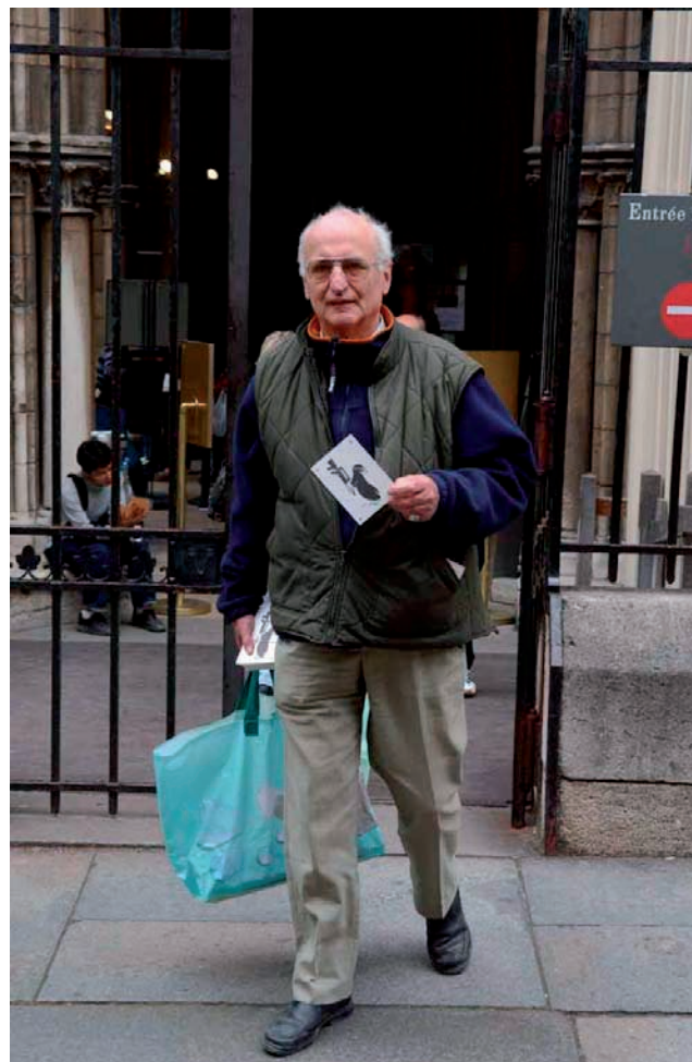
Le Sonderführer en Aktion. Ici, sortie de la Sainte-Chapelle

Nous fûmes cinq. Tout s'est parfaitement bien passé. Nous avons placé des cartes sur les voitures stationnées dans le Palais de justice, distribué des cartes et des brochures aux touristes, nombreux le samedi, mais aussi à des avocats de passage à la permanence des flagrants délits.