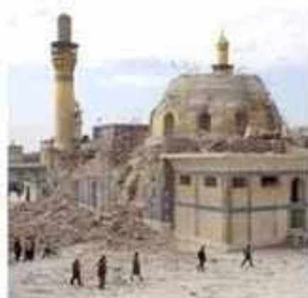
Feb. 22, 2006

Un jour cette affaire sera éclaircie. La presse nous vend ces jours-ci l'idée que l'auteur de l'attentat aurait été un Irakien d'Al Qaida et qu'il vient de se faire tuer. A d'autres !