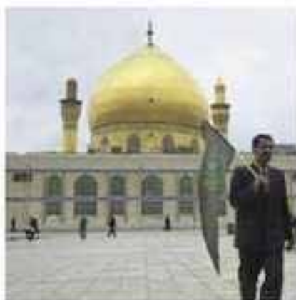
Feb. 2, 2004