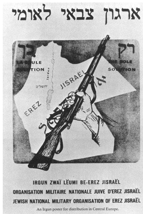
Manifesto propagandistico dell'Irgun