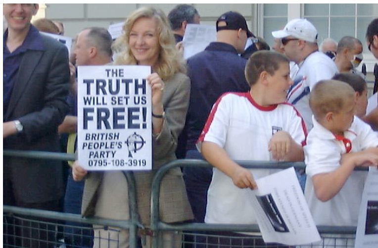
Rushton &amp; Renouf 2007