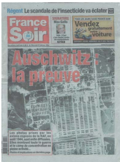
France-Soir du 21/01/04.