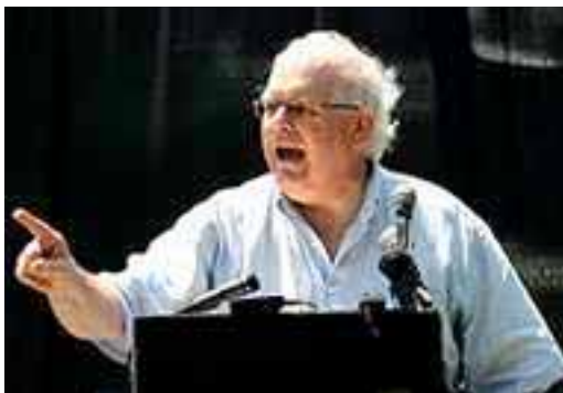
Webster Griffin Tarpley

chiamare terrorismo geopolitico, o terrorismo che mira a riorganizzare tutte le vicende del mondo, tutto il sistema politico mondiale adesso si basa su questa presunta guerra al terrorismo, che naturalmente è una grande bugia.