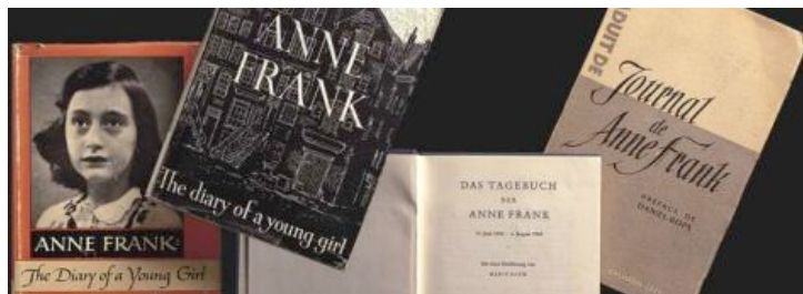
A hamisítvány első kiadásai

Eddig a történet. Egyetlen kis probléma van vele: A Napló – ahogy azt Robert Faurisson, a lyoni egyetem professzora bebizonyította – kétséget kizáróan hamisítvány.