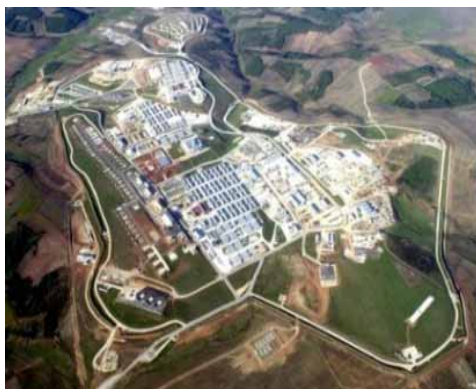
Camp Bondstell - Estado marionete de Kosovo

OS funcionários em Camp Bondsteel raramente são vistos fora do campo e as suas actividades são de carácter sigiloso. Embora outras pequenas patrulhas dos USA na KFOT, façam tentativas de integração com a população local, os militares americanos só saem de Bondsteel, em helicópteros ou muito raramente em grandes comboios fortemente armados.