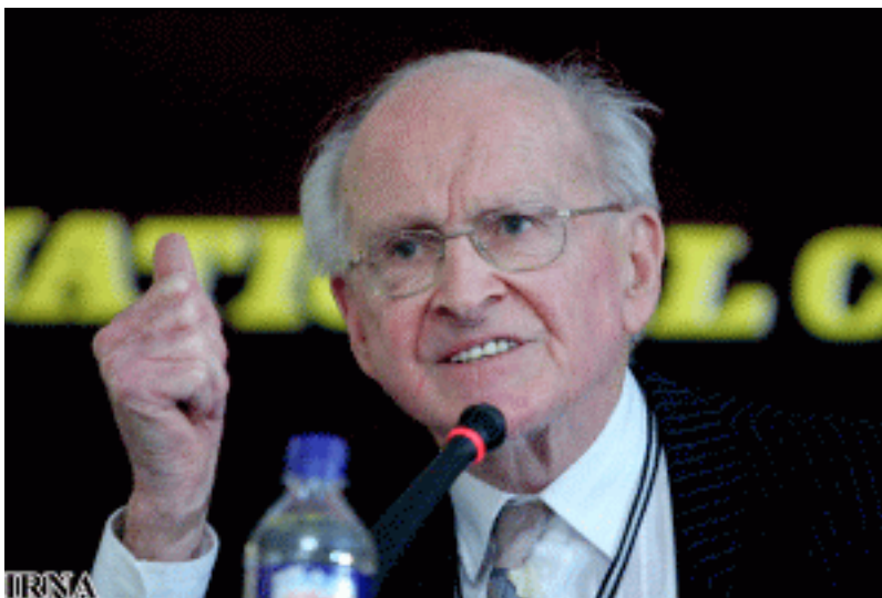
Robert Faurisson no Teerão